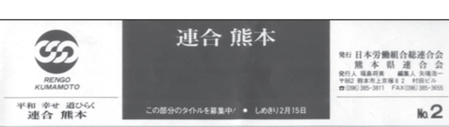
1990年1月発行 タイトル募集がありました