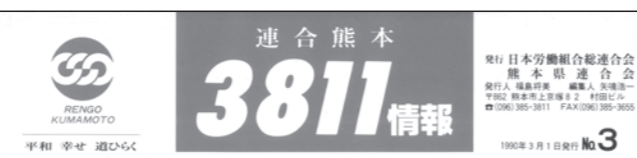
1990年3月発行 今の表紙となりました